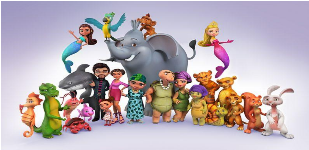
அனிமேஷன் முறையில் காட்டுன் படங்கள் தயாரித்தல்